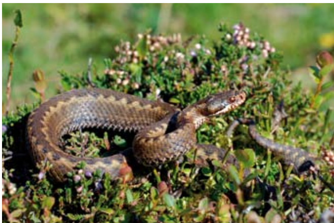
■ La Vipère de Séoane ( Vipera seoanei ), une espèce "Quasi menacée"

L'assèchement des zones humides et le comblement des mares représentent une menace pour la survie de la Grenouille des champs (En danger critique) et du Pélobate brun (En danger). La pollution des milieux aquatiques a également contribué à la raréfaction des espèces dépendantes de ces habitats naturels.