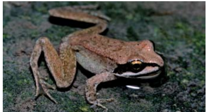
■ La Grenouille des Pyrénées ( Rana pyrenaica ), classée "En danger"

L'évolution des milieux due au déclin du pastoralisme a entraîné une forte régression de l'habitat de la Vipère d'Orsini (En danger critique), également menacée localement par des aménagements divers (routes, pistes de ski...). Victime des incendies, de l'urbanisation et de la construction d'infrastructures routières et ferroviaires, la Tortue d'Hermann est aujourd'hui très fragilisée (Vulnérable en France et En danger dans le Var). A ces menaces, s'ajoute la collecte illégale d'individus pour les deux espèces.