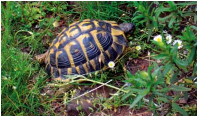
Tortue d'Hermann Testudo hermanni