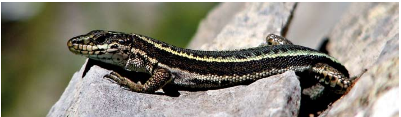
■ Le Lézard du Val d'Arán ( Iberolacerta aranica ), une espèce classée "En danger"

Répartition des 37 espèces de reptiles et des 34 espèces d'amphibiens évaluées en fonction des différentes catégories de la Liste rouge (nombre d'espèces entre parenthèses)